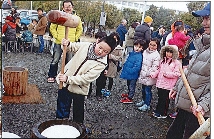
“山中もちひかり”のウスをつく子どもたち