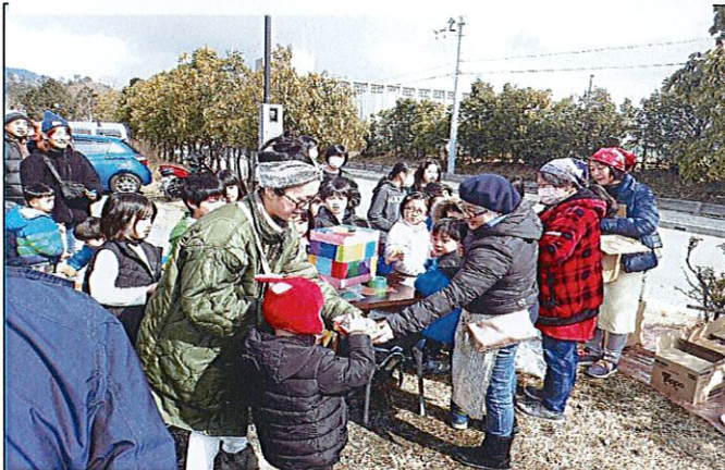
受付け と “お年玉”（もう2月なんだけど？）抽選会