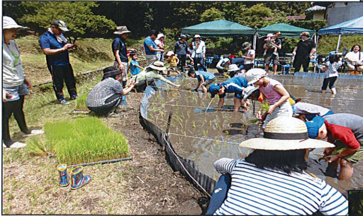
6月の9日に、みんなで田植え

昨年5月、餅つき大会の行事担当が学区社協と決まった時、どうせなら地域でつくったもち米で考えたところから《山中もちひかり物語》が始まった。山・比二つの地域の人と暮らしの交流もまた、大きな目的の一つだった。