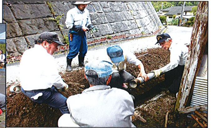
この物語は田んぼへの水路みちを作るところから始まる