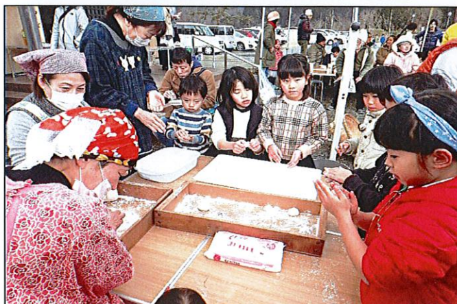
なんてっだって、手作りのお米に手づくりのおもちが一番！