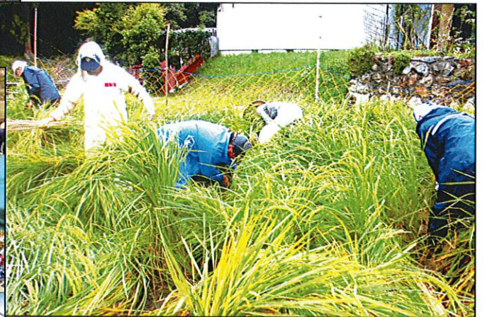
台風一過；力尽きし友かえるがごと 稲穂を起こす