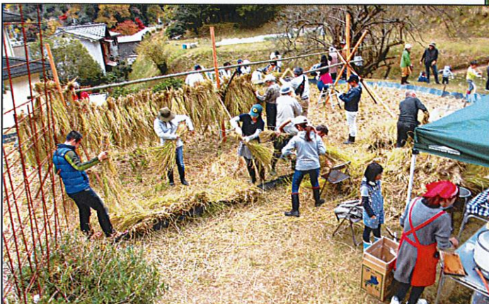
稲刈りから足踏み脱穀、稲わらのはさ掛けまで体験